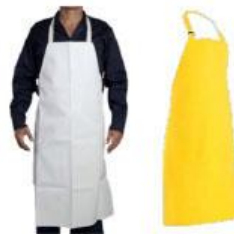
Delantal PVC (Blanco/Amarillo)